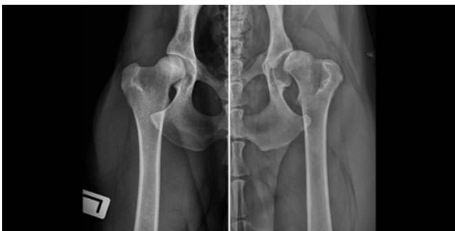
gesunde Hüfte mit rundem Hüftkopf, in tiefer Pfanne vs. kranke Hüfte mit quadratischem Kopf, kaum Pfanne

Die Missbildung entsteht aufgrund genetischer Informationen während des Wachstums des Tieres. Der eigentlich runde Hüftgelenkskopf ist deformiert und je nach Schwere quadratisch. Die Hüftgelenkspfanne, in die der runde Hüftkopf normalerweise perfekt passen soll, ist zu flach und umschließt den Kopf nicht richtig. Daraus ergibt sich zusätzlich eine "lockere Hüfte", der Kopf sitzt also nicht so fest in der Pfanne, wie es der Fall sein soll.